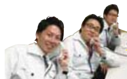
岐阜営業課 ケイちゃんトリオおすすめ

味は、みそ味・ピリ辛みそ味・しょうゆ味・しお味の4種類があります。どれも味がしっかりしているから野菜と一緒に炒めて食べるとご飯がすすみます! 晩酌のおつまみにも♪