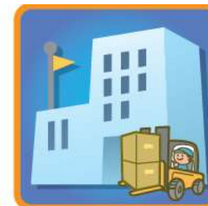
サプライチェーン の途絶