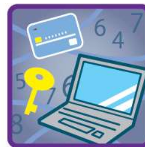
情報セキュリティ 事故