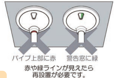
図 【事例】 ペスポジ-eの場合

上記は一例です。商品により、異常時の色表示や確認箇所は様々です。詳しくは取扱説明書をご確認ください。少しでも異常を感じましたら使用を中止し、必ず貸与事業者にご連絡ください。