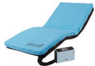
画像 ネクスサスアイビー

また、何かに接触しマットレスに亀裂が入ると空気が抜けてしまいます。異常を感じましたら貸与事業者にご連絡ください。