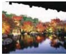
■好古園 《住所》兵庫県姫路市本町68 《営業時間》9時～17時 (紅葉会期間中の金～日・祝日は20時まで)